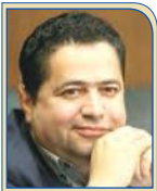
حسین پیرمزدن رئیس هیات نظارت راهبردی تشکل‌های اتاق ایران

وضعیت آشفته اقتصاد کشور عوامل متعددی دارد و نمی‌توان همه نوسانات اخیر را تنها به عامل خارجی مانند تحریم‌ها ارتباط داد. به‌طور قطع عوامل داخلی هم در این شرایط نقش بسزایی دارد. اقتصاد کشور از بخش خصوصی، تشکل‌ها و نهادهای